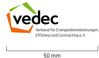
Standardgröße DIN lang Hoch- und Querformat