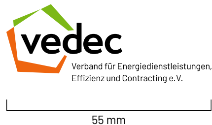
Standardgröße DIN A4, DIN A5