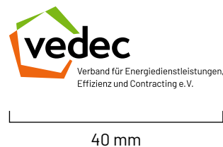
Mindestgröße für Printprodukte