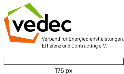
Mindestgröße für Screenanwendungen